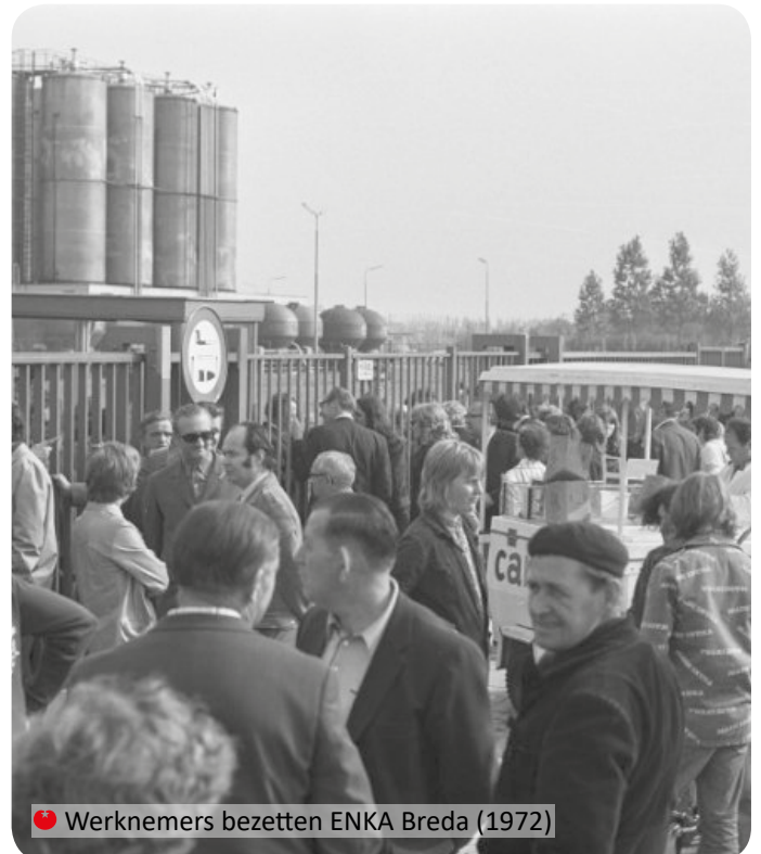
Werknemers bezetten ENKA Breda (1972)