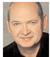
Jan Marijnissen, voorzitter SP