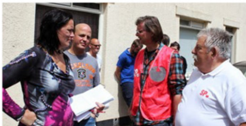
Beeld van de actie in de Vestingstraat.

Wij willen onder andere weten waarom WonenBreda deze brief heeft verspreid die tot onrust leidt, maar geen oplossing biedt. Wat is het plan van de