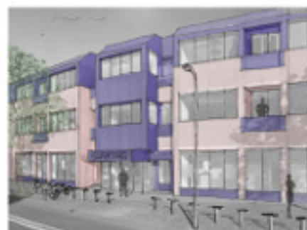
Appartementen in een leegstaand kantoorpand aan de Oude Vest.

Op 1 oktober 2010 is de Wet kraken en leegstand van kracht geworden. De Wet kraken en leegstand biedt gemeenten een aanvullend instrumentarium om leegstand van niet-woonruimte – dus ook kantoren - aan te pakken. Met de nieuwe wet kregen gemeenten namelijk de