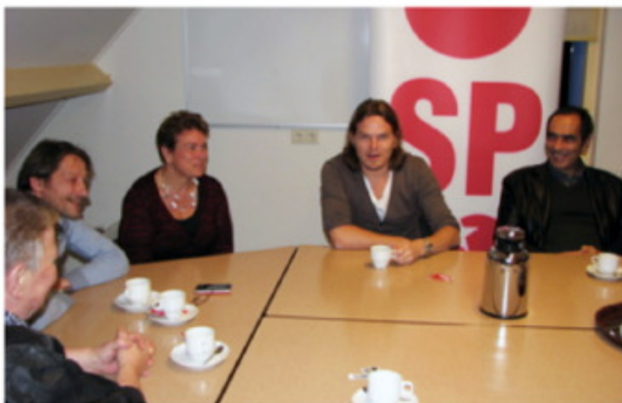
Archiefbeeld van een soortgelijke avond in oktober 2012.

Op deze avond krijg je informatie over het werk van de gemeenteraadsfractie, ook kun je vragen stellen aan onze raads- en commissieleden. Verder vertellen we hoe de procedure tot 19 maart gaat verlopen. De programcommissie (schrijvers van het verkiezingsprogramma voor 2014) en de kandidatencommissie (opstellers van de voordracht voor de kieslijst) zijn aanwezig om je vragen te beantwoorden. Twijfel je nog of je je zult gaan kandideren?