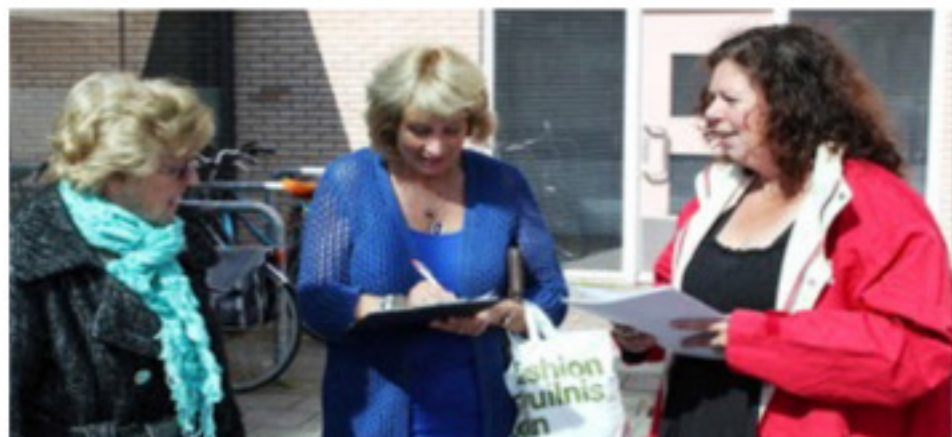
Beeld van de actie in de Hoge Vucht (Foto Paul Marijnissen).

Het is duidelijk dat de buurt wil dat de Schatkamer open blijft. Tijdens de zaterdagopenstelling van de bieb op 25 mei heeft de SP met zo'n 400 mensen gesproken. Bijna iedereen wil dat de bibliotheek open blijft.