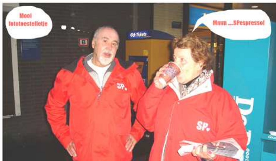
Al vroeg op pad om de ZO! kranten uit de delen aan treinreizigers.

We zijn van plan als afdeling om veel actie te gaan voeren. Het nieuwe kabinet dat na "het feest van de democratie" gevormd is, zal daartoe waarschijnlijk alle aanleiding toe geven. Vrijwel iedereen die slachtoffer van de kredietcrisis is geworden, zonder daar verantwoordelijk voor te zijn,