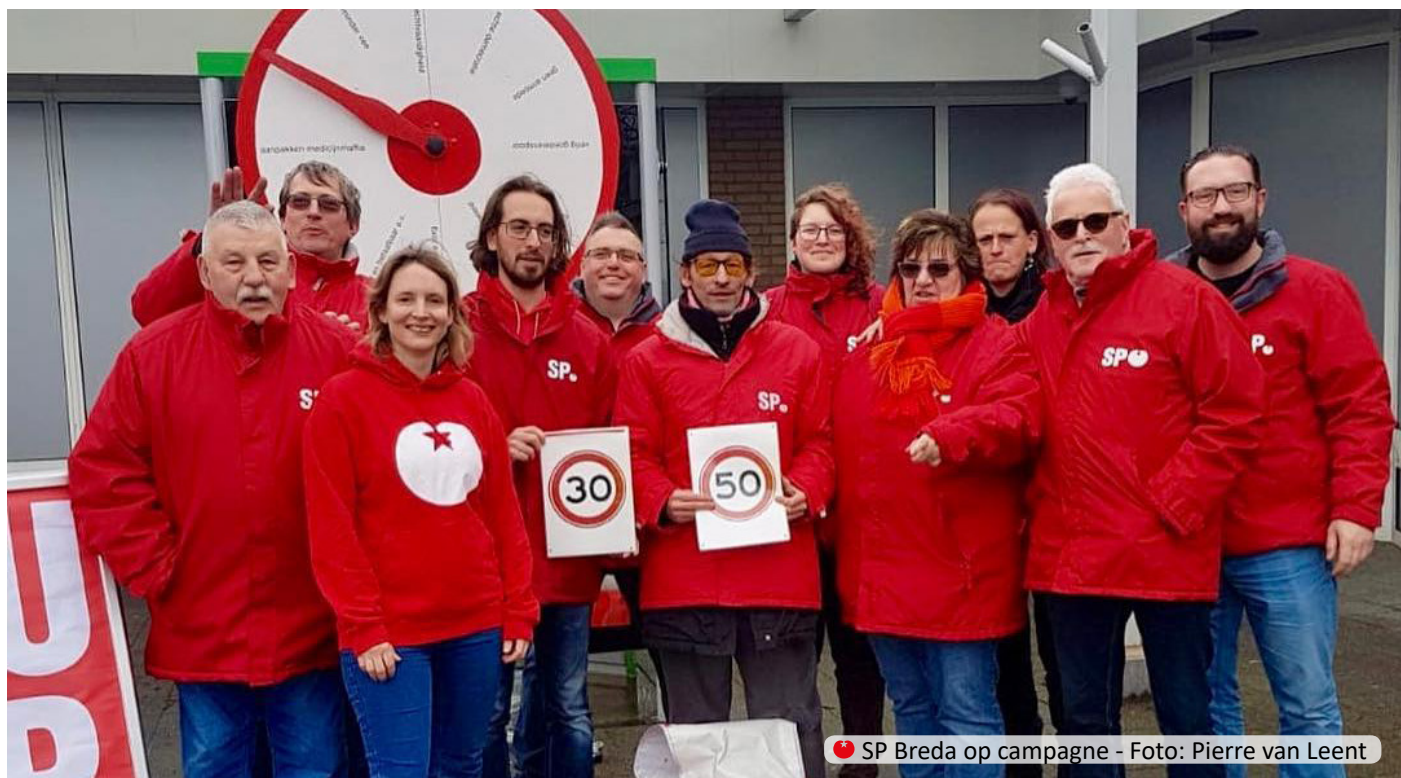
SP Breda op campagne

En heel binnenkort staan er weer nieuwe zaken op de agenda, bijvoorbeeld de organisatie van de 1 mei viering. Stilzitten is er zeker niet bij.